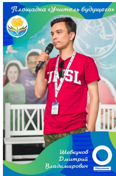
Социолог, преподаватель социологии Института истории и социологии ФГБОУ ВО «УдГУ»