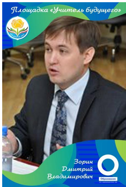
и.о. начальника отдела «К» МВД по УР

Медиакомпетентность сегодня становится частью профессиональной субкультуры специалистов, условием социализации личности в современном медиамире, фактором успешности человека в быстро меняющемся социуме; средством познания поликультурного мира и получения новых знаний; способ самопрезентации и реализации потенциальных возможностей личности