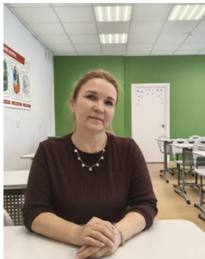
Заместитель директора по НМР