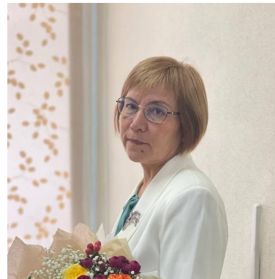
Директор МБОУ «Лудорвайская СОШ имени Героя Советского Союза А.М. Лушникова»